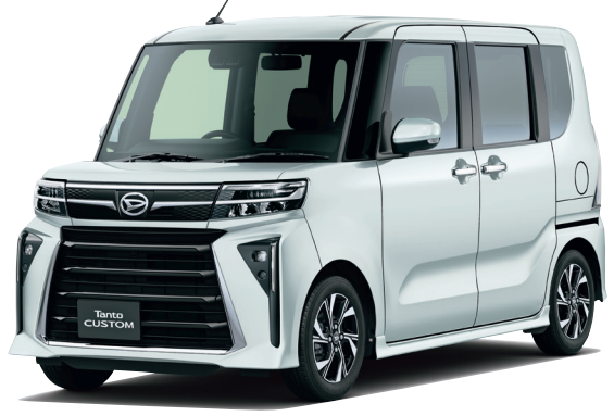
タントカスタムX 4WD・660cc・CVT